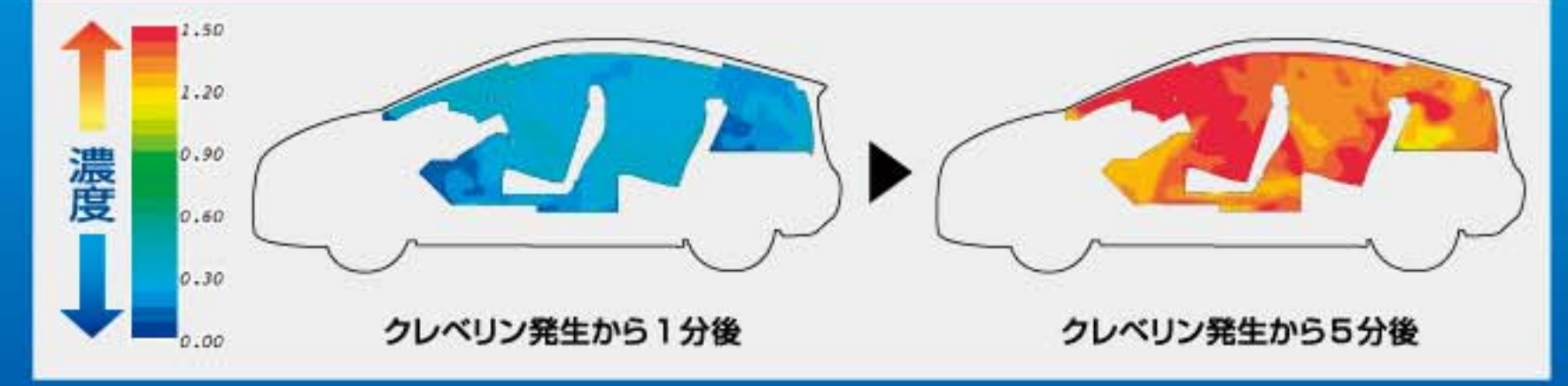
クレベリン発生から1分後