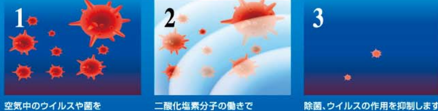
空気中のウイルスや菌を