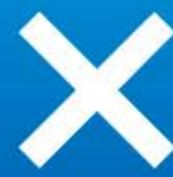
除菌、ウイルスの作用を抑制します